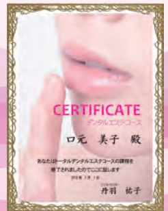
コース修了証を発行